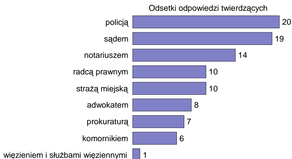
RYS. 2. CZY W OSTATNICH DWÓCH LATACH KTOŚ Z PANA(I) NAJBLIŻSZEJ RODZINY LUB PAN(I) OSOBIŚCIE MIAŁ(A) JAKĄŚ SPRAWĘ ALBO ZAŁATWIAŁ(A) COŚ I KONTAKTOWAŁ(A) SIĘ Z:

W ostatnich dwóch latach respondenci lub członkowie ich najbliższej rodziny stosunkowo najczęściej mieli styczność z policją (20%), nieco rzadziej z sądem (19%), a dopiero w dalszej kolejności z notariuszem (14%), radcą prawnym (10%), strażą miejską (10%), adwokatem (8%), prokuraturą (7%) i komornikiem (6%). Tylko nieliczni (1%) kontaktowali się ze służbami więziennymi.