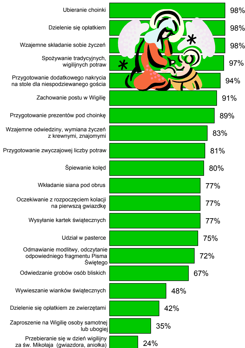
RYS. 1. KTÓRE Z PONIŻSZYCH ZWYCZAJÓW WIGILIJNYCH ZACHOWYWANE SĄ W PANA(I) RODZINIE?