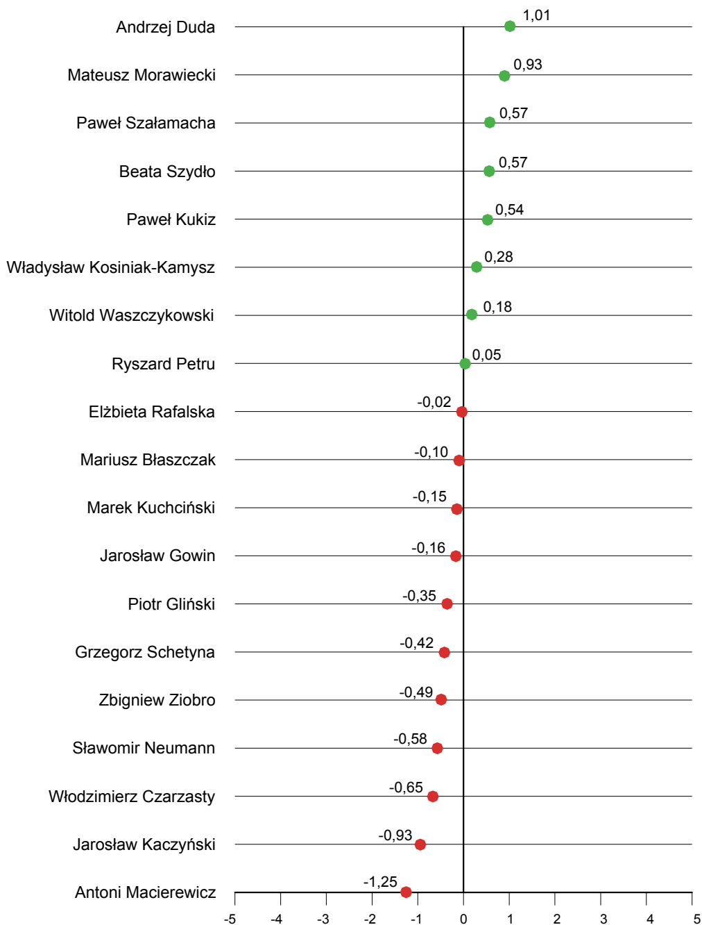
RYS. 2. ZAUFAJĄCE DO POLITYKÓW W LUTYM 2016 – ŚREDNIE NA SKALI OD -5 „GŁĘBOKA NIEUFAJĄCE” DO +5 „PEŁNE ZAUFAJĄCE”