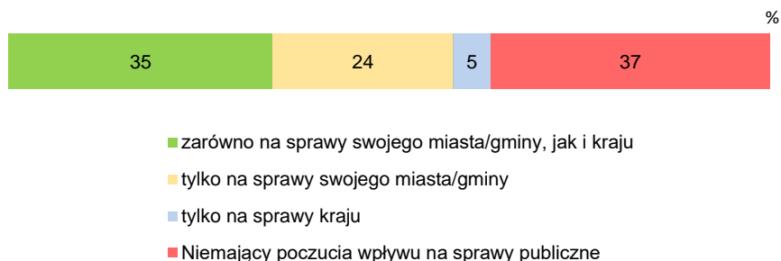
RYS. 3. Badani uważający, że ludzie tacy jak oni mają wpływ:

Przekonaniem, że działania zwykłych ludzi nie mają przełożenia na sprawy publiczne, wyróżniają się osoby znajdujące się w złej sytuacji materialnej, mające wykształcenie podstawowe lub zasadnicze zawodowe, najstarsi respondenci, mieszkańcy dużych miast (od 100 000 do 499 999 ludności) oraz niemający sprecyzowanych poglądów politycznych. Z kolei wpływ obywateli zarówno na to, co dzieje się w kraju, jak i lokalnie, częściej niż przeciętnie deklarują najmłodszy badani, najlepiej wykształceni, uzyskujący najwyższe dochody per capita oraz najbardziej zaangażowani w praktyki religijne.