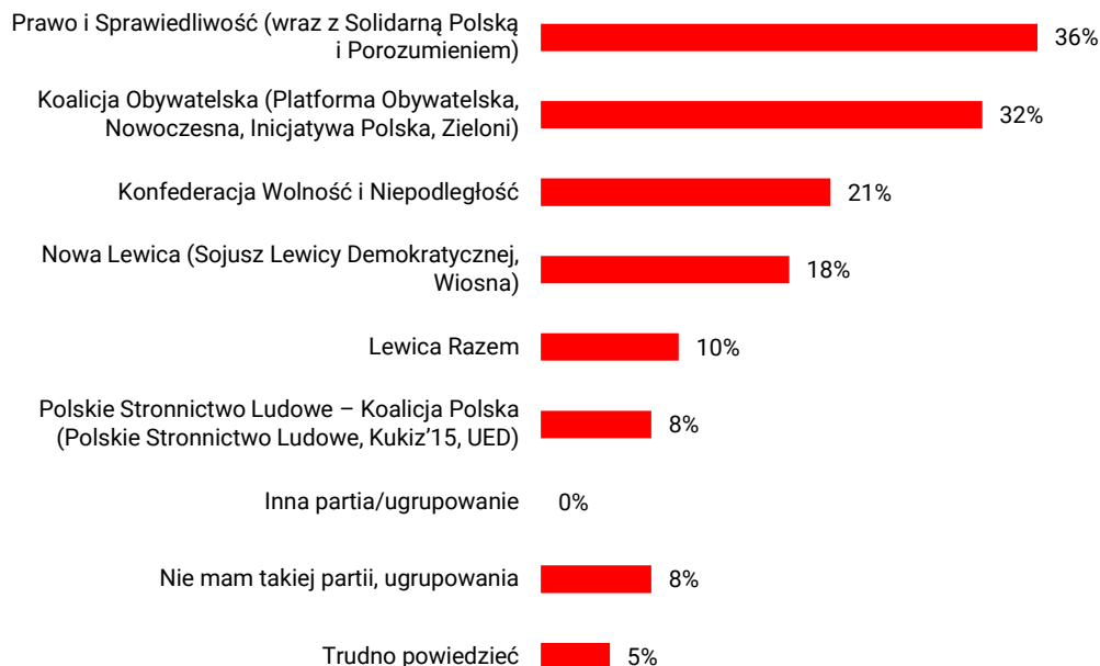
RYS. 2. Na kandydata której partii/bloków partii na pewno by Pan(i) nie głosował(a)?

W elektoracie PiS, co oczywiste, z największą niechęcią traktowana jest opozycyjna KO (60% głosów braku wsparcia). O połowę mniejszy odsetek wyborców tej partii nie głosowałoby na Nową Lewicę (30%). Część zwolenników PiS na pewno nie poparłaby w wyborach Konfederacji (19%) oraz Lewicy Razem (17%). Z relatywnie najmniejszą niechęcią zwolenników rządzących partii spotyka się blok PSL-Koalicja Polska (12%).