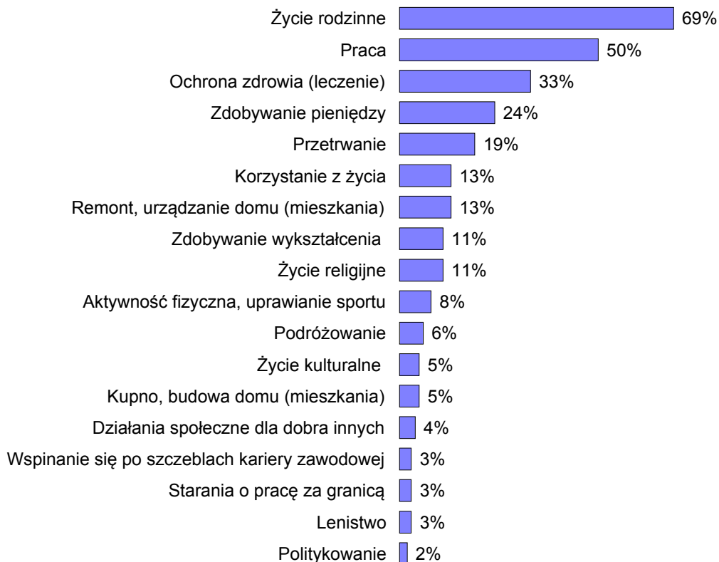
RYS. 2. KTÓRY Z WYMIENIONYCH RODZAJÓW DZIAŁALNOŚCI STANOWI OBECNIE TREŚĆ PANA(I) ŻYCIA CODZIENNEGO? CZEMU POŚWIĘCA PAN(I) NAJWIĘCEJ CZASU I ENERGII?

Procenty nie sumują się do 100, ponieważ badani mogli wybrać trzy odpowiedzi