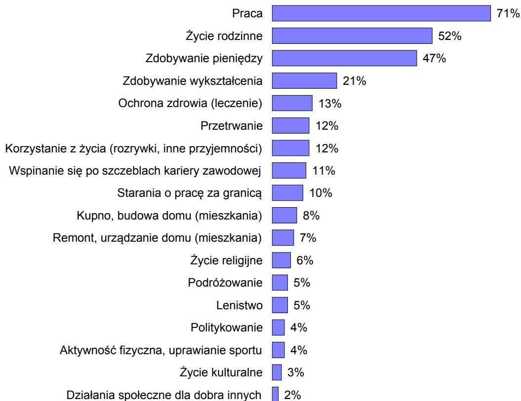
RYS. 1. CZEMU OBECNIE NAJGORLIWIEJ POŚWIĘCAJĄ SIĘ LUDZIE, KTÓRYCH PAN(I) ZNA, KTÓRYCH PAN(I) SPOTYKA NA CO DZIEŃ?

Procenty nie sumują się do 100, ponieważ badani mogli wybrać trzy odpowiedzi