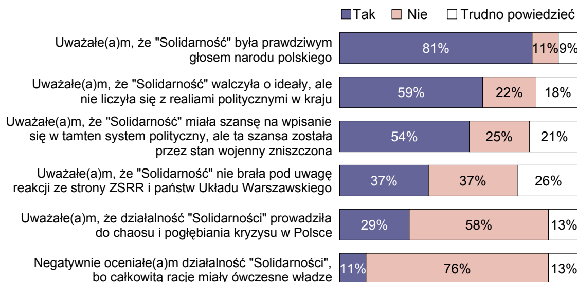
RYS. 2. CO MYŚLAŁ(A) PAN(I) W TAMTYM CZASIE O „SOLIDARNOŚCI”? O KAŻDYM Z PODANYCH STWIERDZEŃ PROSZĘ POWIEDZIEĆ, CZY SIĘ PAN(I) Z NIM ZGADZA CZY TEŻ NIE?

Odpowiedzi osób, które w 1981 roku miały przynajmniej 17 lat