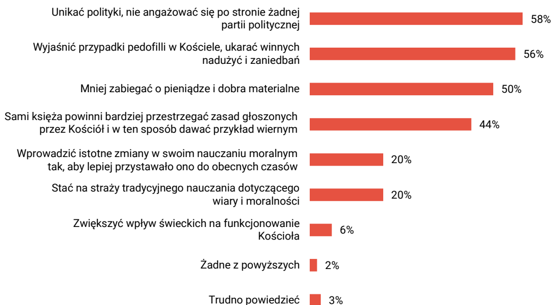
RYS. 3. Co powinien zrobić Kościół, aby wzmocnić swój autorytet w społeczeństwie? Jakie są Pana(i) główne oczekiwania? Może Pan(i) wybrać nie więcej niż trzy odpowiedzi