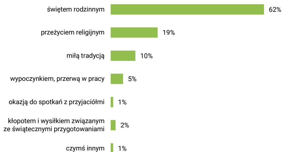
RYS. 1. Czym dla Pana(i) są święta Bożego Narodzenia? Czy przede wszystkim są one:

Boże Narodzenie za przeżycie religijne uznają ponadprzeciętnie często kobiety (25% wobec zaledwie 12% mężczyzn), badani powyżej 55 roku życia (po 26% w grupie wiekowej 55–64 lata oraz 65-latków i starszych wobec 8% w grupie 25–34 lata), respondenci mieszkający na wsi (22% wobec 15% mieszkańców największych miast), o poglądach prawicowych (28% wobec 8% sympatyzujących z lewicą) oraz – co oczywiste – osoby częściej praktykujące religijnie (57% wśród uczestniczących w praktykach religijnych kilka razy w tygodniu wobec 5% wśród niepraktykujących) – zob. tabelę aneksową 1.